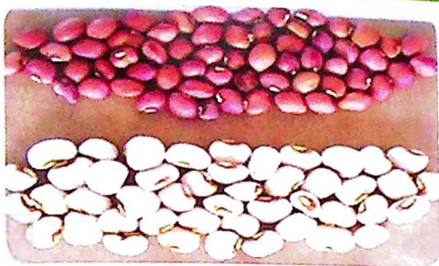
Picha inaonesha utofauti wa rangi kwenye punje za maharage