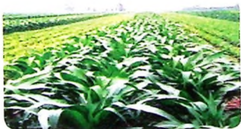
Picha inaonesha Mfanano wa tabia katika majani